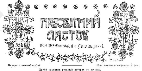
Рис. 1. Титульна сторінка часопису «Просвітній Листок» (№ 5 від 1 березня 1916 р.), присвяченого Т. Шевченкові

Апостол правди. Не вмирай правдива, Не вмирай ласка, І світлий не вмирає На дні морі — польза, Не сльоз, ані жемчог І слова злого. Шевченко (Кавказ). Наш великий український поет Тарас Григо-