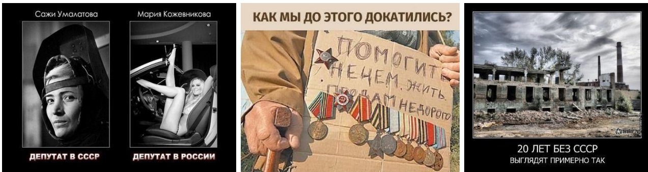
Рис. 6. Метод контрастів та порівняння: контент