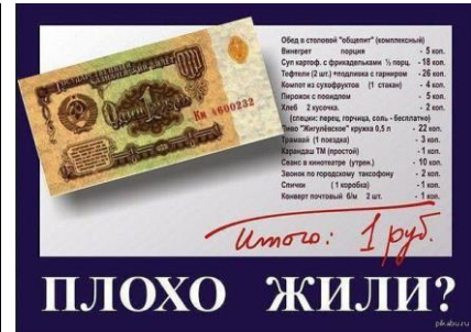
Рис. 2. Метод вибіркового добору інформації: контент