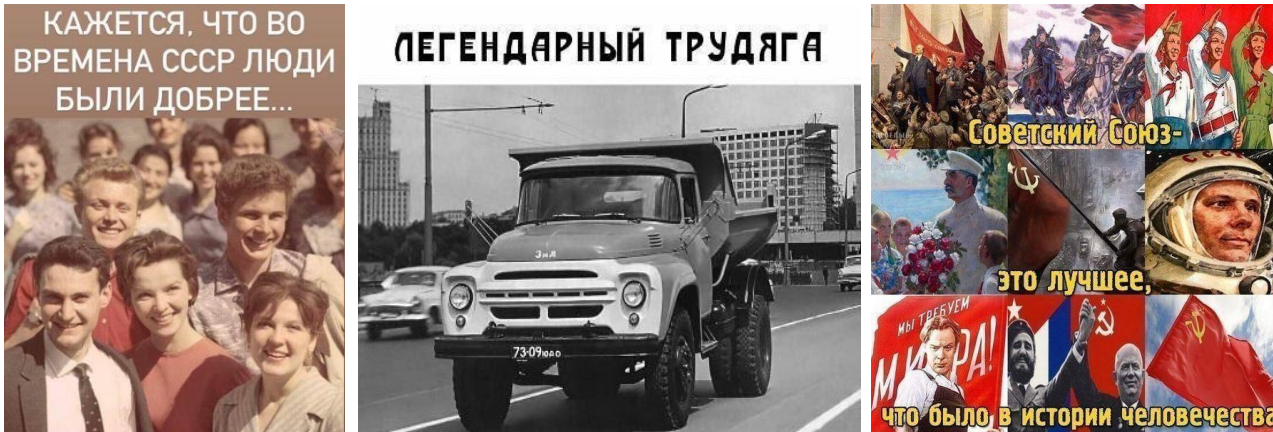
Рис. 7. Метод позитивних і зрозумілих образів: контент

Оцінюючи специфіку й особливості промоції супернарративу ностальгії за СРСР, маємо визначити його інтегрований характер, який передбачає використання складних цифрових, управлінських і психотехнологій. Така комплексність дає його промоутерам змогу гнучко реагувати на запити цільових аудиторій, обставини зовнішнього середовища та виробляти ефективний контент, який проходить крізь фільтри національних ЗМІ.