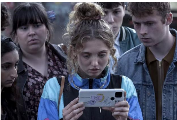
Фото 5. Кадр із фільму «Червона троянда» (2023)

Але між ними багато відбувається, що вказує на оновлений розвиток мікржанру екранного життя, який зосереджується на наративах, які розповідаються майже виключно через екран комп'ютера та телефону. Ось як зазвичай відбувається історія: підліток завантажує злий додаток, заходить на злий вебсайт або натискає зле посилення; зловмисники використовують камеру та мікрофон пристрою як метод спостереження; кіберпереслідувачі використовують таке стеження, щоб завдати шкоди підлітку. (2023)