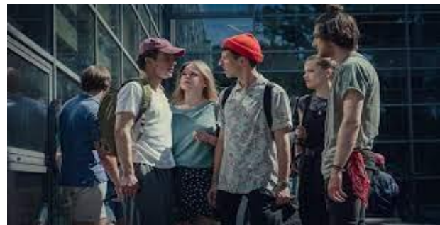
Фото 4. Кадр із фільму «Зберігай спокій»

Наприклад, у рецензії сайту PPE.pl зазначено: «Досить специфічно тут показаний спосіб життя молоді, який іноді здається неприродним, навіть костюмованим. Шкода, адже конфлікт між молодими людьми та батьками, також пов'язаний з недовірою один до одного, досить грамотно побудований» (Зоховскі, 2022). В інших рецензіях польських медіа на фільм ідеться і про дорослішання, межу батьківської опіки, тобто актуалізується така складна зона дитячо-батьківських відносин, у якій традиційно створюється найбільше напруження. Однак якщо в українському й американському серіалах розрив між батьками і підлітками показаний як катастрофічний, то в польському проблема окреслена через показ виходу — розуміння й терпіння, взаємодопомогу, що знижує проблемне напруження, але водночас, здається, знижує і рівень зацікавлення глядача-підлітка цим контентом.