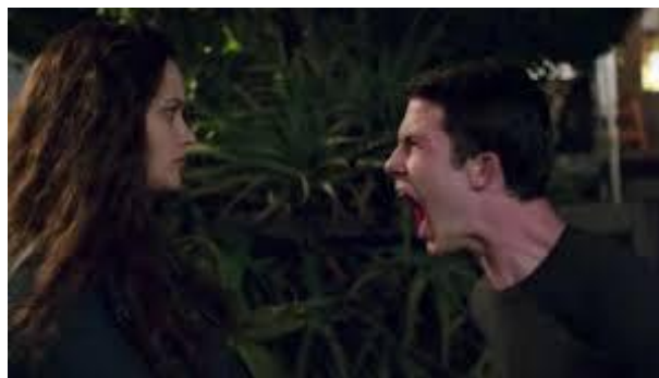
Фото 2. Кадр із серіалу «13 причин чому»

Натомість після перегляду другого сезону складається враження, що творці вирішили зреагувати на закиди ЗМІ після першого сезону й вирівняти баланс в історії Ханни Бейкер, адже в першому сезоні був створений романтичний образ невинної жертви, що страждала від байдужості світу, жорстокості й брехні інших підлітків. Натомість другий сезон робить усіх персонажів більш об'ємними, показує, що в кожного з них були свої страждання, і вони також піддавалися знущанню з боку інших, відчували байдужість батьків, боялися бути не прийнятими оточенням. Кожен підліток постає в усій складності своїх переживань. Також у другому й третьому сезонах звучить прямий заклик не вдаватися до самогубства, а звертатися по допомогу, не дивитися серіал на самоті, обговорювати свої переживання з іншими. До речі, у серіалах «13 причин чому» і «Перші ластівки» наприкінці кожної серії на екран виводиться інформація про те, куди можна звернутися в складній психологічній ситуації. Це ще раз демонструє спрямування такого контенту на психологічну підтримку глядачів певної вікової категорії. В одному з інтерв'ю творці серіалу «Перші ластівки» вказали, що надихалися серіалом «13 причин чому», але це цілком своєрідний контент на національному ґрунті (Медіаняня, 2019).