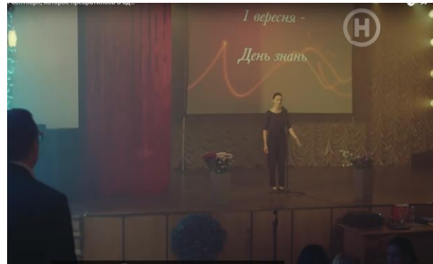
Фото 3. Кадр із фільму «Перші ластівки» (сезон 1, серія 1)

Польський серіал «Зберігай спокій» дещо відрізняється за рівнем відображення проблем і специфікою сюжету, однак тим помітніше буде в аналізі, що в ньому, хоч і пунктирно, накреслені ті самі проблеми підліткового віку — недовіра до батьків, самотність, ризик піддатися впливові, наркотики.