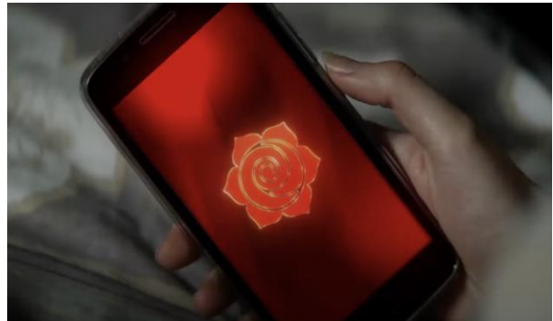
Фото 1. Кадр із фільму «Червона троянда» (2023)

видовищ» (2015, с. 32). Так, творці серіалу «Червона троянда» привертають увагу незвичною графікою небезпечного онлайн-додатка.