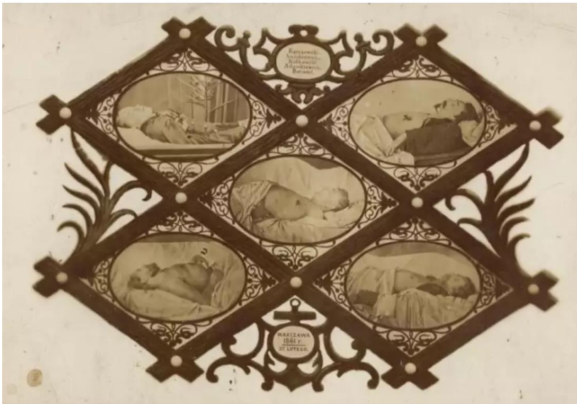
Рис. 1. К. Беєр. П'ять полеглих, 1861

Ще принаймні до середини ХХ століття посмертна фотографія не вважалася чимось дивним, страхітливим або загрозовим. Вона була природною складовою меморіальних практик, поширених у багатьох культурах. «Бачення жанру post mortem як жахливого та навіть дикого — переважно ознака сьогодення» (Філіпова, 2021). Промовистим прикладом, який пов'язує такі фото з етичними номінаціями чутливого візуального контенту в медіях сьогодення, можна назвати світлину 1861 року «П'ятеро полеглих» Кароля Беєра.