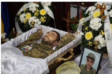
Рис. 2. Після важкого поранення помер 34-річний воїн з Тернопільщини. (2024, 15 вересня). ПЕРШІЙ онлайн. https://www.gazeta1.com/statti/pislyavazhkhogo-poranennya-pomer-34-richnyj-voyin-z-ternopilshhyny