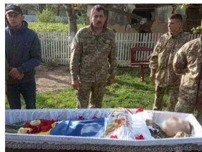
Рис. 4. Вбили за три дні до ротації: на Тростянецьчині прощаються із загиблим у зоні ООС військовим. (2024, 29 липня). Вінниця.info. https://vinnitsa.info/article/zahynuv-zatry-dni-do-rotatsiyi-na-trostryanechchyni-proshchayut-sya-iz-zahyblim-u-zoni-oos-viyskovym-foto

Тому, навіть якщо необхідність висвітлення таких подій не підлягає сумніву, спосіб, у який ці новини подаються, дійсно є дискусійним питанням, і журналісти мають вирішити, чи представляти всю правду, чи поважати жертв. Іншими словами, виклик, із яким стикаються журналісти, полягає в тому, як збалансувати два основні демократичні принципи — людську гідність і право громадськості на інформацію. У цьому контексті необхідно враховувати не лише порушення гідності жертв, але й почуття їхніх близьких. У багатьох випадках родичі померлого несуть його право на конфіденційність і людську гідність, оскільки жертва вже мертва. Вони утворюють вторинне коло осіб, які можуть бути ображені поширенням графічних зображень. Медіа повинні розглянути потенційну цінність показу таких зображень.